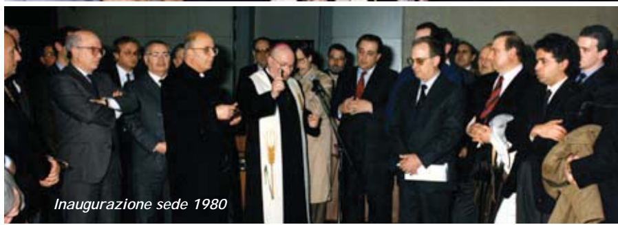
Inaugurazione sede 1980