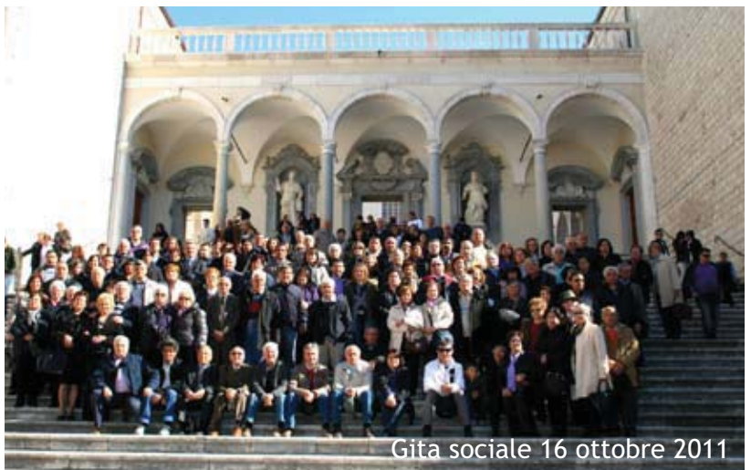
Gita sociale 16 ottobre 2011