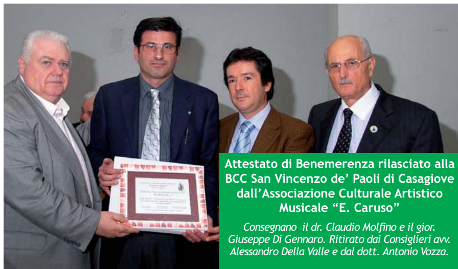
Attestato di Benemerenzia rilasciato alla BCC San Vincenzo de' Paoli di Casagiove dall'Associazione Culturale Artistico Musicale "E. Caruso"